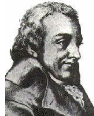
Johann Gottlieb Fichte

„Fast durch alle Länder von Europa verbreitet sich ein mächtiger feindselig gesinnter Staat, der mit allen übrigen im beständigen Krieg steht, und der in manchem fürchterlich schwer die Bürger drückt: es ist das Judentum. - - - Menschenrechte müssen sie haben, ob sie gleich dieselben uns nicht zugestehen; denn sie sind Menschen und ihre Ungerechtigkeit berechtigt uns nicht, ihnen gleich zu werden. - - -